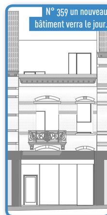
N° 359 un nouveau bâtiment verra le jour.

Ces travaux ont aussi pour objectif de proposer des surfaces commerciales modernes qui répondent aux attentes des commerces, et notamment des lieux de plus grande surface.