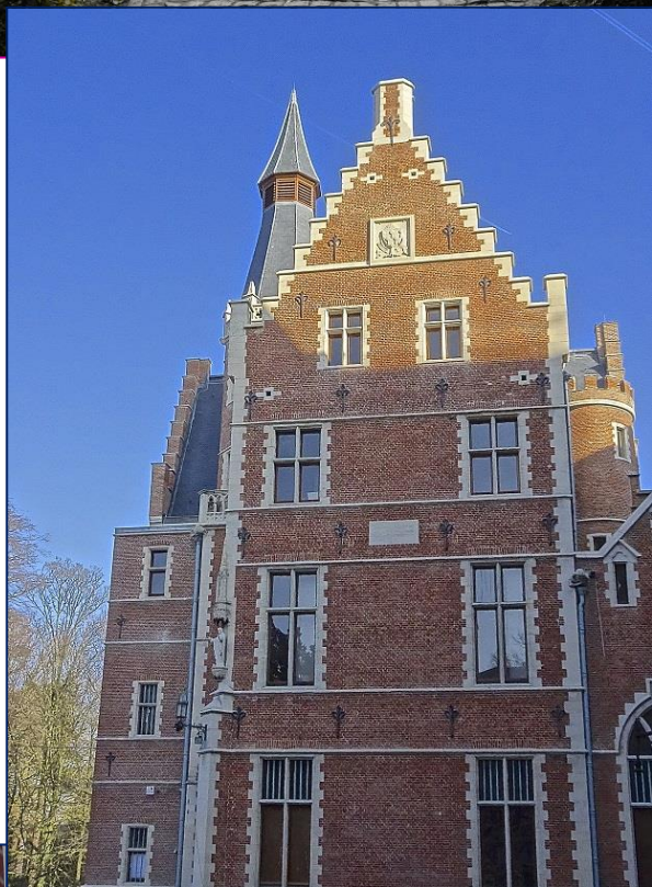
Le castel de Linthout (1867-69), classé en 2002,