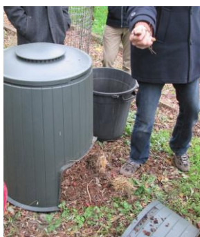
Composts de quartier

La vie associative de nos quartiers est riche et foisonnante. La commune édite « Le guide de la vie associative », qui recense les activités très variées des associations implantées à Woluwe- Saint-Lambert. L'ouverture d'une « Maison des associations », située place Saint-Lambert, permet l'organisation d'activités diverses par le milieu associatif.