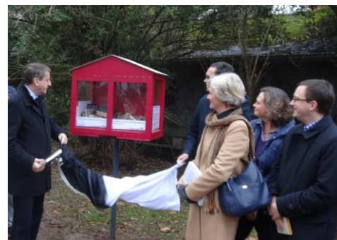
boîtes à livres

Le Collège est attentif aux nombreuses initiatives citoyennes et veille à soutenir les projets qui favorisent le lien social dans les quartiers (potagers collectifs, composts de quartier, boîtes à livres, ...).