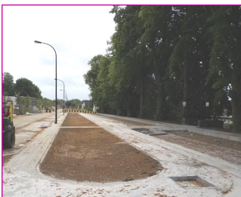
Déminéralisation des sols (av. Dumont - aménagements en cours)