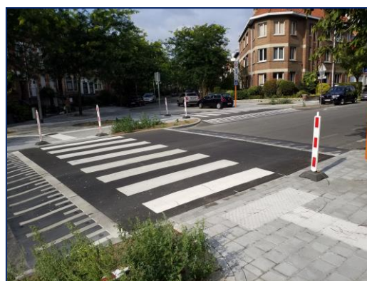
Sécurisation des carrefours