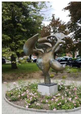
« Le Folklore » P. Bertrand Square Marinus