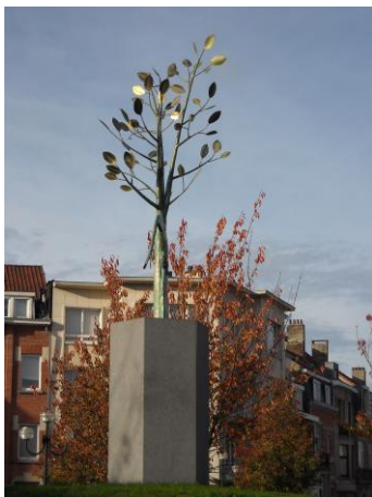
« De la crosse du fusil germe L'arbre de vie » - C. Krekels Place du 8 mai 1945